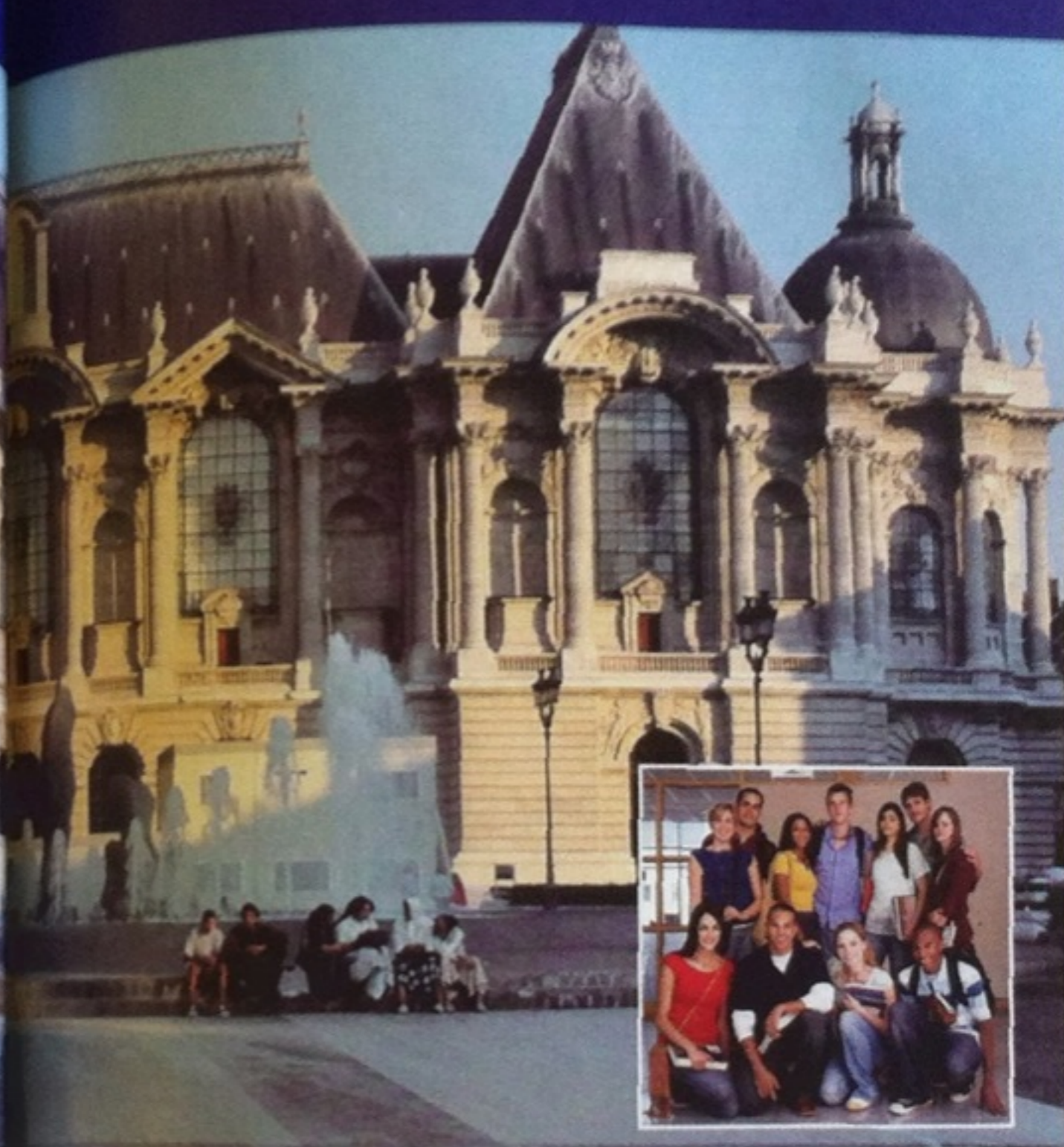
le Musée des Beaux-Arts, Lille